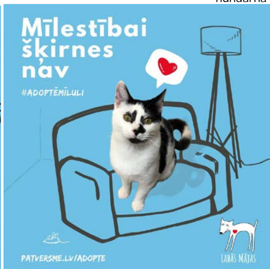
Bilder från en kampanj, om att inte bara leta efter djur med en fin ras när man adopterar från djurhemmet.