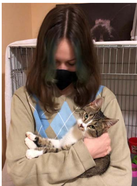
En av alla volontärer, som hjälper till på djurhemmet, här på kattavdelningen.