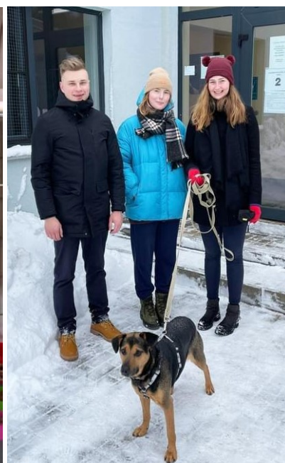
Många volontärer kommer till djurhemmet varje vecka, för att ta ut hundarna i den närliggande skogen.